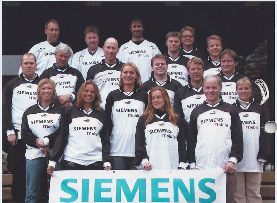
Glade idrettsfolk på Siemens i ny habit

Tekst: Stein Bjørnbekk