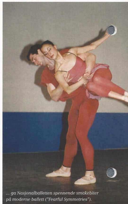
... ga Nasjonalballetten spennende smakebiter på moderne ballett (" Fearful Symmetries ").

Våre gjester ble ikke bare foret med kunst denne kvelden, de fikk også en solid porsjon siemenskunnskap med på kjøpet. Først gjennom velkomstordene fra vår administrerende direkt-